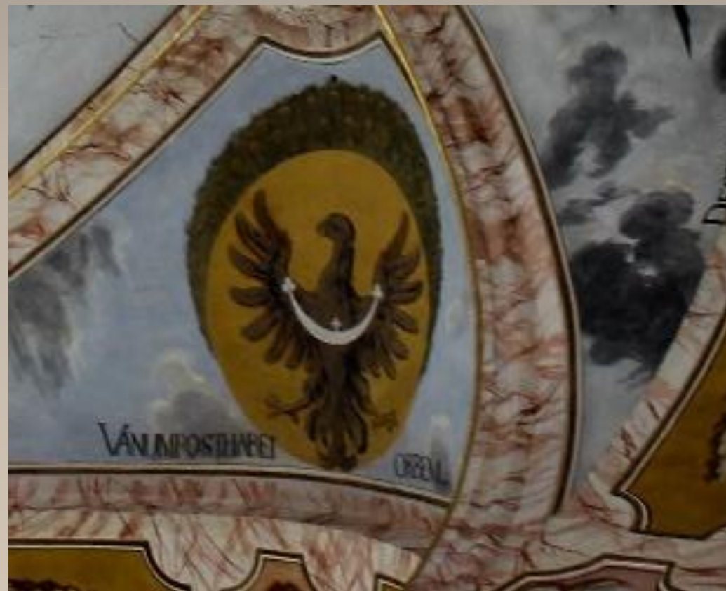
HERB DOLNEGO ŚLĄSKA