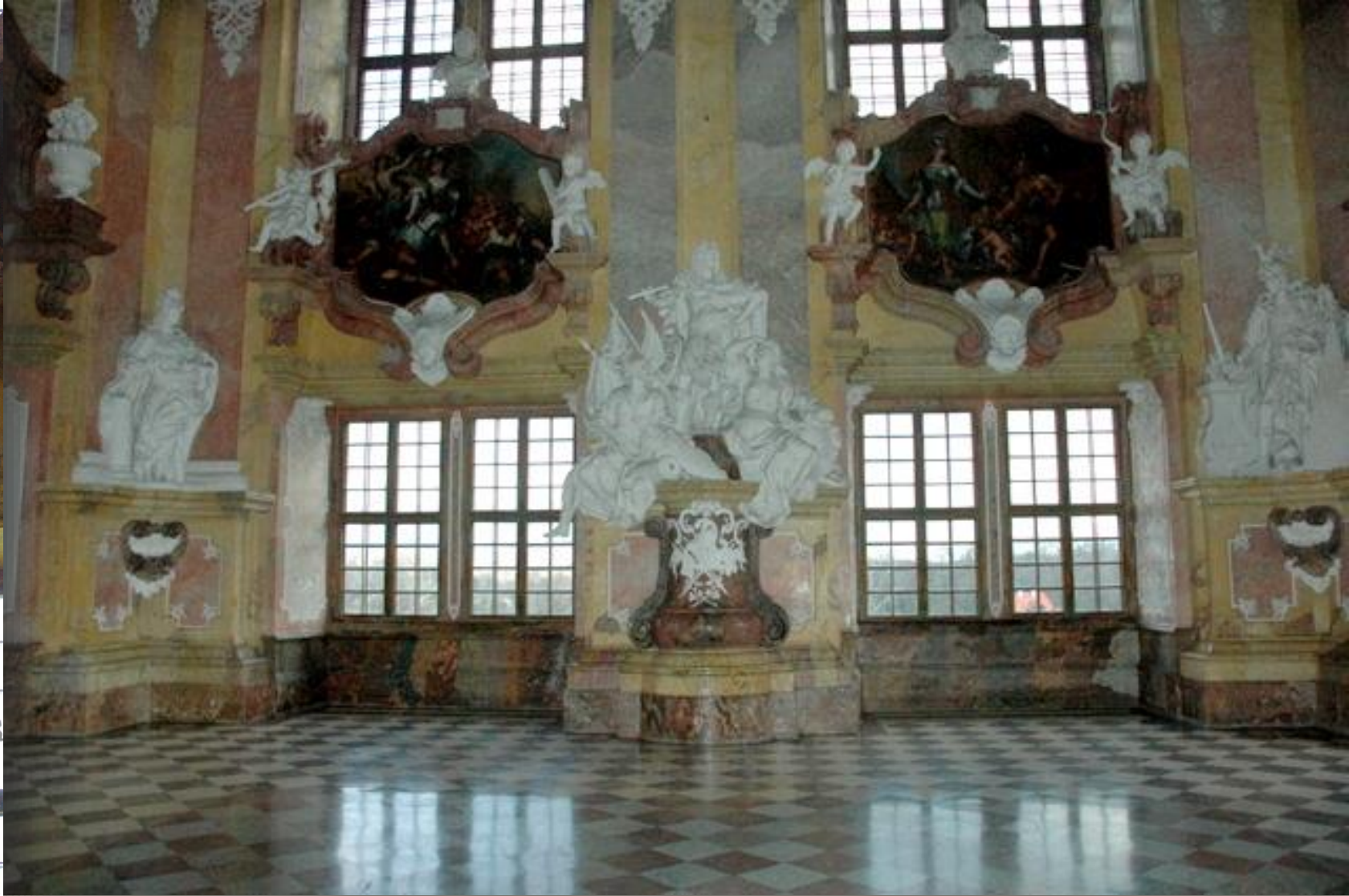
Figura Karola VI, któremu towarzyszą ustawione w narożnikach wschodniej ściany figury alegoryczne – Fortitudo (Siła), Constantina (Stołość).